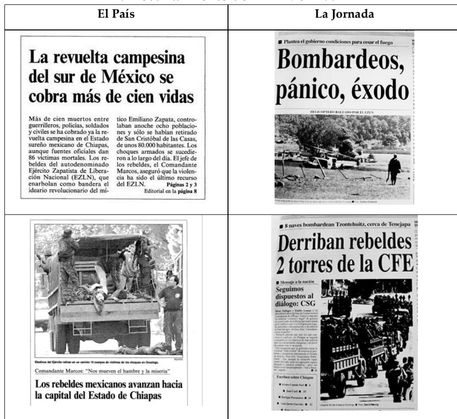
Tabla 7. Portadas periodísticas de La Jornada y El País con relación al levantamiento del EZLN en 1994