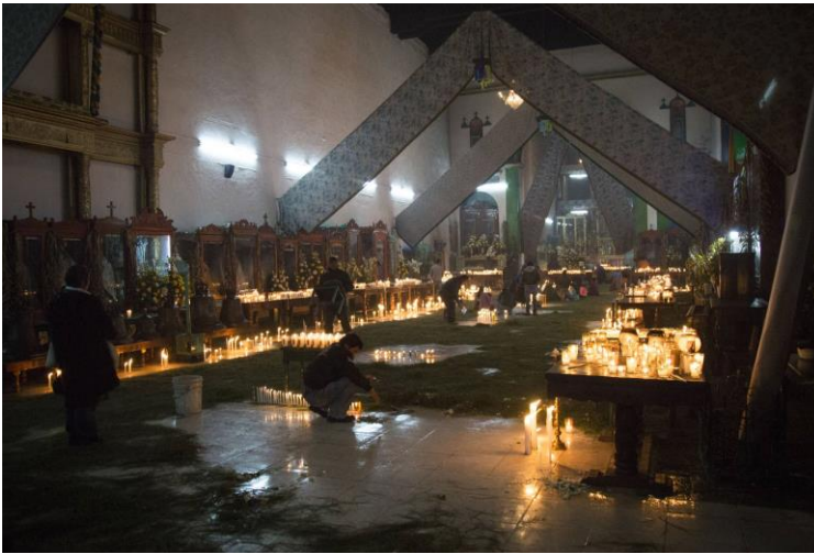
Iglesia de San Juan Chamula SAUL RUÍZ