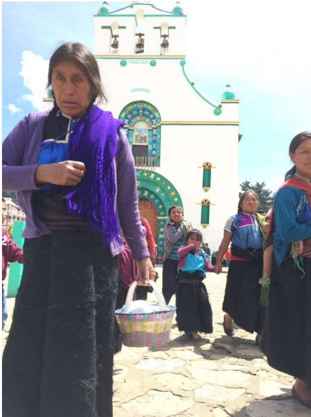
Mujeres saliendo de la iglesia de San Juan Chamula el jueves. J. GARCÍA