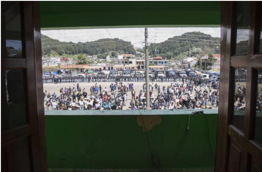
Vista de la plaza de San Juan Chamula desde el balcón del Ayuntamiento SAUL RUÍZ

58. Le exigían que entregara la subvención de 7.000 pesos (340 dólares) que