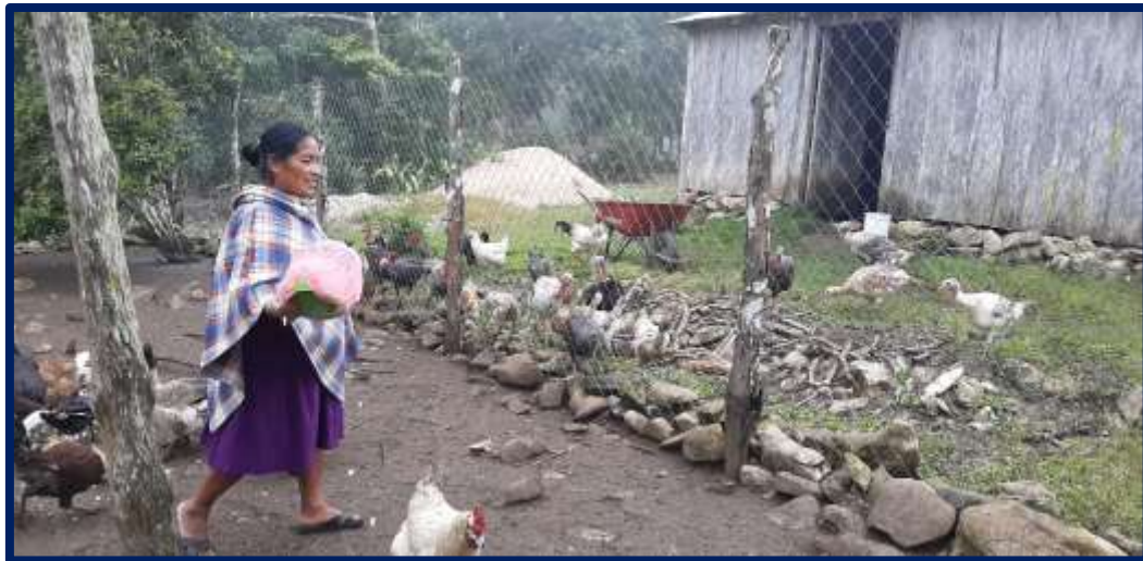
Figura 2. Productora llevando alimento a sus aves de traspatio

Se observó que la mayoría de las UPT cuentan con aves de corral (gallinas, guajolotes y patos) (Figura 3) con amplia diversidad, siendo las gallinas la especie más popular. Ante esto, la distribución de la parvada en las UPT se clasifica en gallinas, gallos y pollos (tanto pequeños como en crecimiento). El 85.71% de los encuestados cuentan con gallos, con una media de 3.37 \pm 3.6 individuos; el 100% contó con gallinas de distintas edades con una media de 11.2 \pm 6.7 aves, teniendo una proporción de gallos-gallinas de 1:3 aproximadamente; y el 66.67% de los productores criaban parvadas promedio de 8.2 \pm 7.8 pollitos (Cuadro 6), con diferentes proporciones entre comunidades (Cuadro 7). El Sabinito reportó más individuos, con una media de 13.57 \pm 6.25 ejemplares. Estos resultados son similares con los obtenidos por Gutiérrez-Triay et al. (2007), quienes en el estado de Yucatán, encontraron que el 97.3% de los