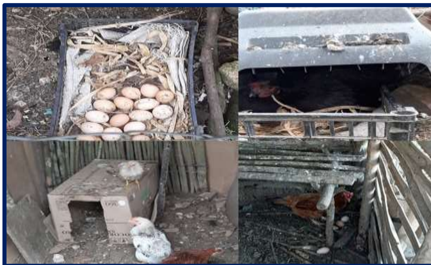
Figura 4. Tipos de nidos encontrados en las UPT de comunidades marginadas del municipio de Berriozábal, Chiapas

Se logró identificar en la totalidad de las UPT, que existen gallineros de diversos materiales (Figura 5) como bambú, palos de madera, bolsas plásticas y unos cuantos, de lámina, elaborados por los hombres de familia principalmente; con base en lo anterior, el 65.08% de los entrevistados, mencionaron que la crianza de sus gallinas es mixta, es decir, las aves utilizan los gallineros para pernoctar (98.41%) y en la mañana pasan el día fuera de ellos (Cuadro 14). Esta información difiere con lo reportado por Ruíz et al. (2014), quienes informaron que en Pantepec, Chiapas, las productoras no cuentan con infraestructura para la crianza de sus aves, siendo mayoritariamente el área del patio, el lugar donde se encuentran las aves (68.4%), sin embargo, Rodríguez et al. (2012) reportan que el 100% de los productores cuentan con gallineros coincidiendo con los resultados encontrados en el presente estudio.