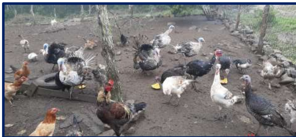
Figura 3. Principales aves de traspatio encontradas en las UPT