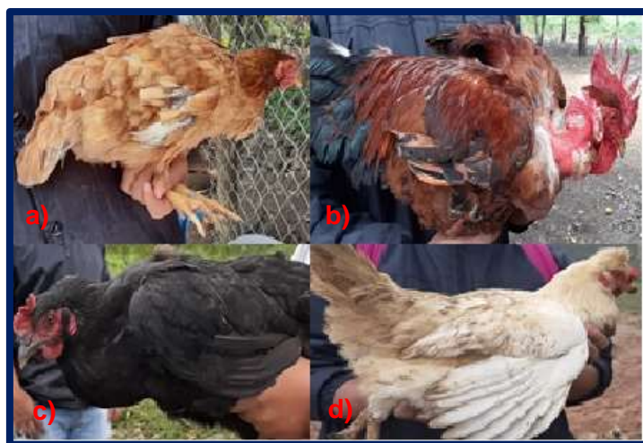
Figura 7. Variedades de coloración de plumaje en gallinas de traspatio de comunidades marginadas del municipio de Berriozábal, Chiapas. a) Trigueña, b) Roja, c) Negra, d) Blanca