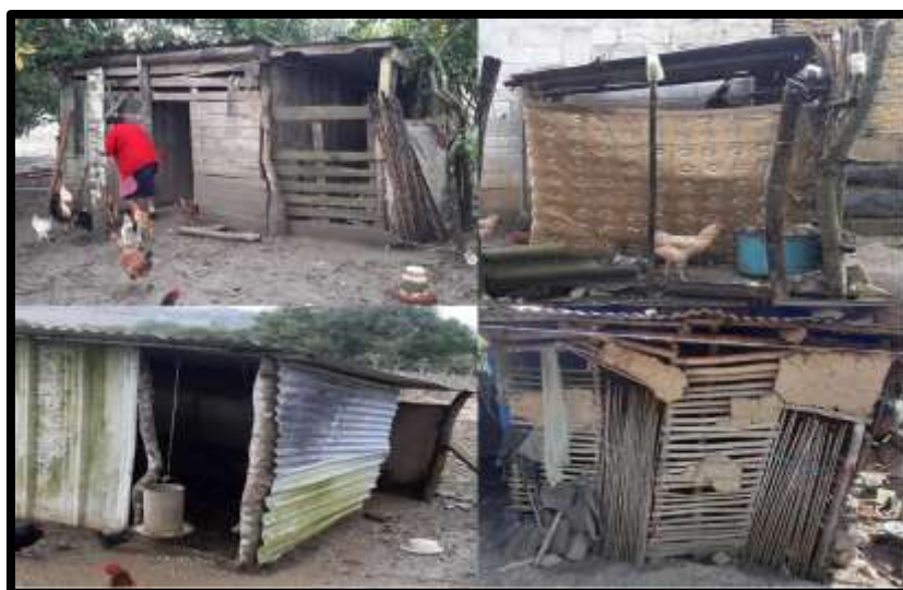
Figura 5. Gallineros comunes encontrados en las UPT de comunidades marginadas del municipio de Berriozábal, Chiapas