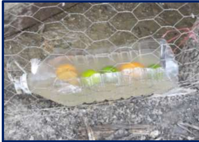
Figura 6. Forma de aplicación de la medicina herbolaria en el agua de bebida en aves de traspatio de comunidades marginadas del municipio de Berriozábal, Chiapas

Las enfermedades en las aves adultas, según los productores, representa un peligro para las UPT, ya que los animales suelen enfermar rápidamente a toda la parvada, afectando directamente a la producción. De acuerdo a las encuestas aplicadas, son diversas las enfermedades que los productores identificaron (Cuadro 23), siendo la gripe (35.48%), el tapú (11.83%) y los parásitos (7.53%) las más frecuentes, el 61.22% de ellos, presentan una mortalidad del 10%, porcentaje bajo en comparación con la mortalidad que se presenta en los pollitos, los productores mencionaron signos como tristeza, heces blancas que como tal no representan una enfermedad y que, por lo mismo, no se agrupan con una patología en específico, pero sí se tomaron en cuenta en el estudio. Al igual que las enfermedades con pollos, el 44.44% de los productores suelen utilizar la medicina herbolaria (Cuadro 24) para tratar las afecciones en sus gallinas, teniendo la creencia que, por ser natural, tiene mejor efecto en las aves. El limón, la sábila y el ajo, fueron las medicinas tradicionales que más se emplean (con 32.14% para limón y sábila y 10.71% para el ajo), algunos más (el 31.75%) utilizan el Catarrol® (20%), paracetamol (15%) y trisulfas (15%) como tratamientos farmacéuticos (Cuadro 25).