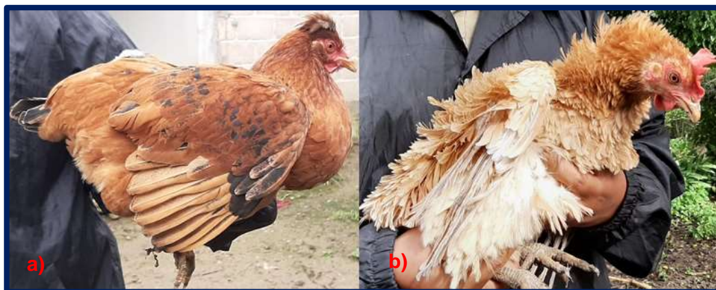
Figura 8. Tipo de plumas en gallinas de traspatio con coloración trigueña en comunidades marginadas del municipio de Berriozábal, Chiapas. a) Lisa, b) Colocha