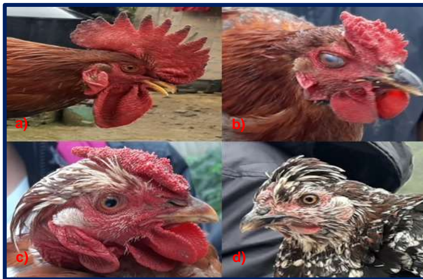
Figura 9. Tipos de crestas en gallinas de traspatio de comunidades marginadas del municipio de Berriozábal, Chiapas. a) Simple, b) Guisante, c) Rosa, d) Escudilla

Zaragoza et al. (2013) identificaron al color rosa (65.2%) como el más frecuente de las coloraciones de cresta, difiriendo con los resultados obtenidos en esta investigación, sin embargo, Gutiérrez (2013) en su estudio realizado en Pantepec, Chiapas,